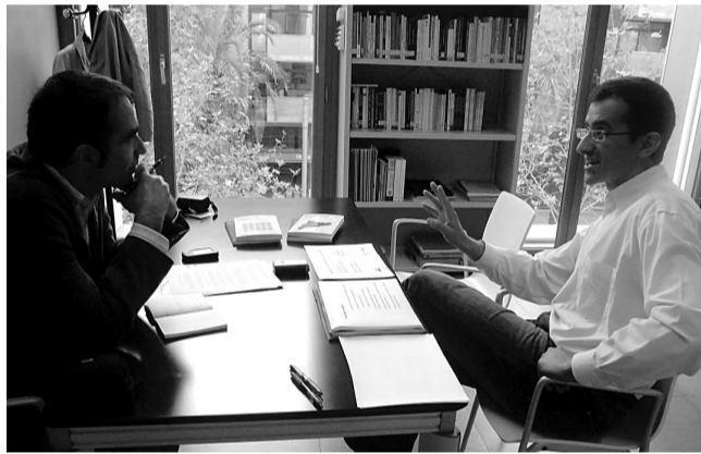
(El text complet de l'entrevista es pot trobar al web de l'AMPA, www.escolavilaolimpica.org )

Pel que fa a la pràctica pedagògica, per exemple, la xarxa continua utilitzant-se per reproduir els models de transmissió de coneixement que arrossegem de fa molt de temps. Tots sabem que avui té molt poc sentit que el professor sigui un transmissor de coneixement quan els alumnes tenen la possibilitat d'arribar a aquest coneixement d'una manera molt fàcil des de fonts molt diverses. Sembla que el professor s'hauria d'anar dedicant a altres coses: a acompanyar l'estudiant en el seu procés d'aprenentatge, a facilitar-li l'adquisició de competències perquè sàpiga identificar allò que és rellevant d'allò que no ho és. La xarxa és una tecnologia molt mal·leable i es pot posar al servei de seguir fent allò que ja feiem, o de fer-ho d'una manera diferent. Probablement s'utilitza per seguir el model tradicional perquè és el més fàcil.