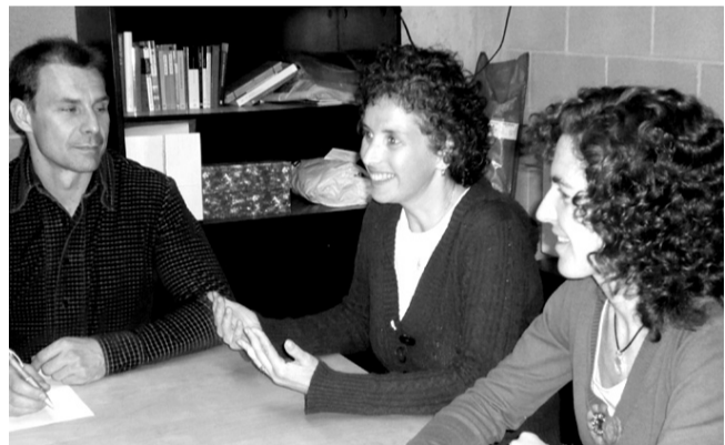
(El text complet de l'entrevista es pot trobar a l'espai de l'AMPA, secció AMPAPA't, de www.vilaolimpica.org )

MCCE.- La Comissió Camí Escolar es va crear fa un any, el mes de març de 2006, i les persones que la formem recomanaríem a les mares i pares que no han estat mai a l'AMPA que val la pena que es plantegin la possibilitat de ser-hi, si poden. També ha estat un important factor de motivació el fet d'haver comptat amb el suport de la Direcció de l'Escola: han facilitat la nostra feina tant com han pogut. Aprofitem aquesta entrevista per agrair a les famílies de l'Escola la seva col·laboració que, gràcies als qüestionaris que l'Escola us va fer arribar, ens ha permès comptar amb 379 qüestionaris (80% d'alumnes), informació necessària per posar en marxa aquesta futura xarxa de Camins Escolars al Poblenou.